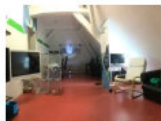
Neues Clubhaus 2019